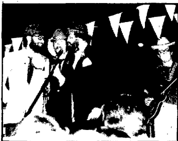
«De Salt a la Fama», un concurs palesament popular

Enguany, «De Salt a la fama» tindrà lloc dissabte dia 3 de juliol a les deu del vespre, a la Plaça de Sant Jaume, davant dels locals del Patronat Can Panxut.